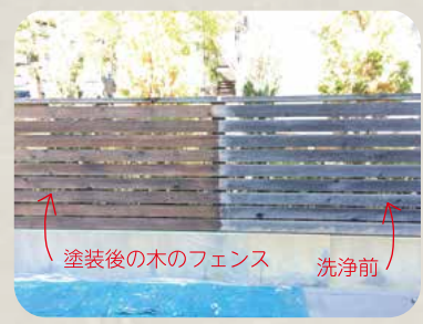
塗装後の木のフェンス 洗浄前

前回 10 年点検をおこなった物件のメンテナンス工事を行いました。今回報告させていただくのは洗浄・塗装工事です。屋根の下に鳩よけの板金取り付けを行う高所作業もあるため、足場を組む工事となりました。まずは洗浄作業から開始です。外壁部分は高圧洗浄で汚れを落としていきます。家の外周部を囲むフェンスと2階デッキの手すり部分は木製のフェンスです。木材の色落ちが気になりましたが、強度に問題はなかったため、既存の木材を再利用しました。しかしそのためには丁寧な作業が求められます。木の表面が毛羽立たぬよう、手作業で汚れを落としていきます。洗浄後に木の腐食・防虫・防カビ効果のある塗料を二度塗りすると見違えるように綺麗になりました。さらに板を取り外し、裏返して反対側も同じく洗浄・塗装を行いました。